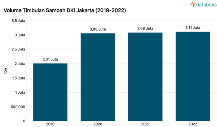
Gambar 1. Volume Timbulan Sampah DKI Jakarta