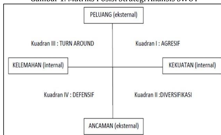
Gambar 1. Matriks Posisi Strategi Analisis SWOT

Keduanya kemudian digabungkan untuk dapat menghasilkan alternatif strategi SO, ST, WO, dan WT. Hasil analisis pada tabel matriks EFAS dan IFAS dapat dipetakan pada matriks posisi strategi organisasi yang dapat dilihat pada Gambar 1 berikut: