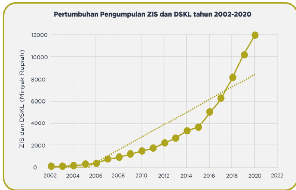
Gambar 4. Tren Pengumpulan ZIS dan Dana Sosial Kelembagaan Lainnya (DSKL) Tahun 2002 s.d 2020